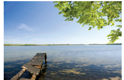
Furesø var omkring år 1900 en af Nord-europas reneste og mest artsrige søer.